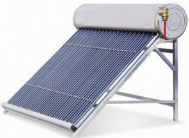
Tanque de Asistencia